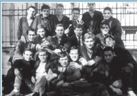
Ecole Normale - Oran

Entre 1866 et 1937, la seule Ecole d'Alger forme plus de 4.000 maîtres, dont 933 indigènes et 1.205 maîtres à compétences multiples (aptitudes agricoles, manuelles et paramédicales).