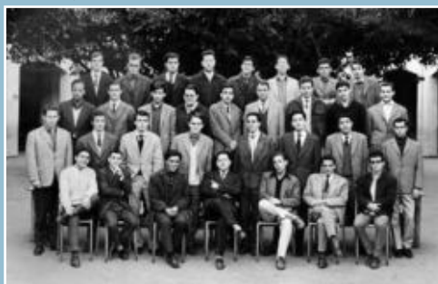
Classe de Première

De 1948 à 1955, cet effectif passe de 22.000 à 36.684 élèves (21.793 garçons dont 6.021 musulmans et 14.891 filles dont 1.111 musulmanes).