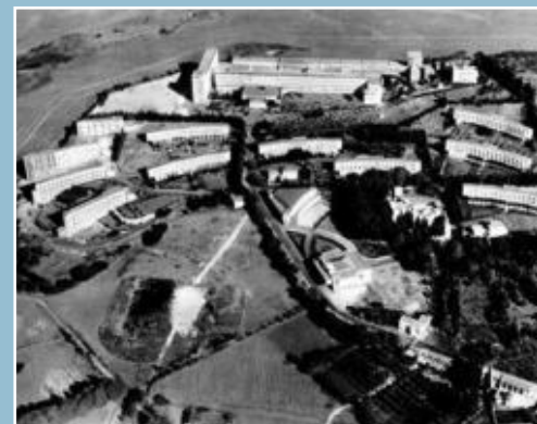
Cité universitaire - Alger

La Faculté de droit se place au 3 ème rang national par le chiffre de ses étudiants et 2 ème par celui de ses chaires.