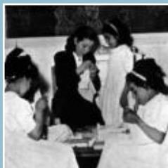
Cours de couture

Les filles : Cet enseignement technique prépare les filles à un apprentissage des arts ménagers et des techniques de la couture familiale.