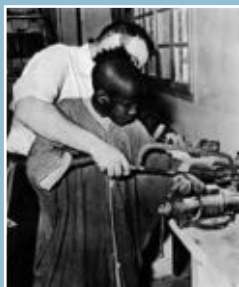
Enseignement de la mécanique

Les garçons : cet enseignement technique prépare les garçons à une main-d'oeuvre qualifiée pour les diverses activités de l'industrie, du commerce, des ateliers et des chantiers et plus spécialement de la mécanique et du bâtiment en milieu rural.