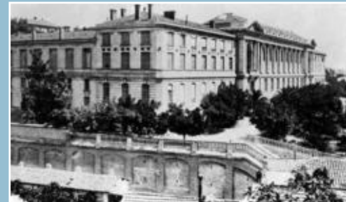
Les Facultés - Alger

En 1879, 3 écoles supérieures (de droit, de lettres et de sciences) rejoignent à Alger, l'école préparatoire de Médecine et de Pharmacie.