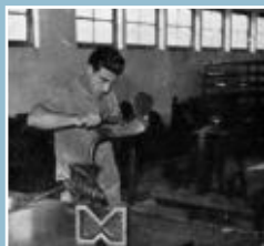
Elève de l'école professionnelle de l'Air

Les filles : Cet enseignement technique prépare les filles à un apprentissage des arts ménagers et des techniques de la couture familiale.