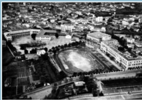
Collège Saint Augustin - Bône

Dés 1835, un lycée (lycée Bugeaud) existe à Alger. Il est complété, en 1860, par un Institut secondaire à Constantine et 4 collèges (Oran, Mostaganem, Bône et Philippeville).