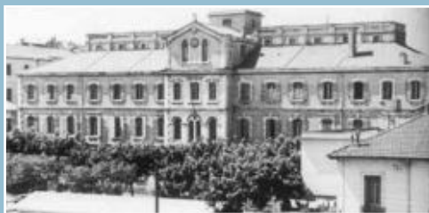
Lycée Stéphane Gsell - Oran