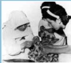
Ouvroir des Soeurs Blanches