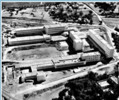
Lycée de Tlemcen

En 1875, l'enseignement secondaire compte 2.100 élèves (1.460 français, 212 étrangers, 212 israélites, 226 musulmans).